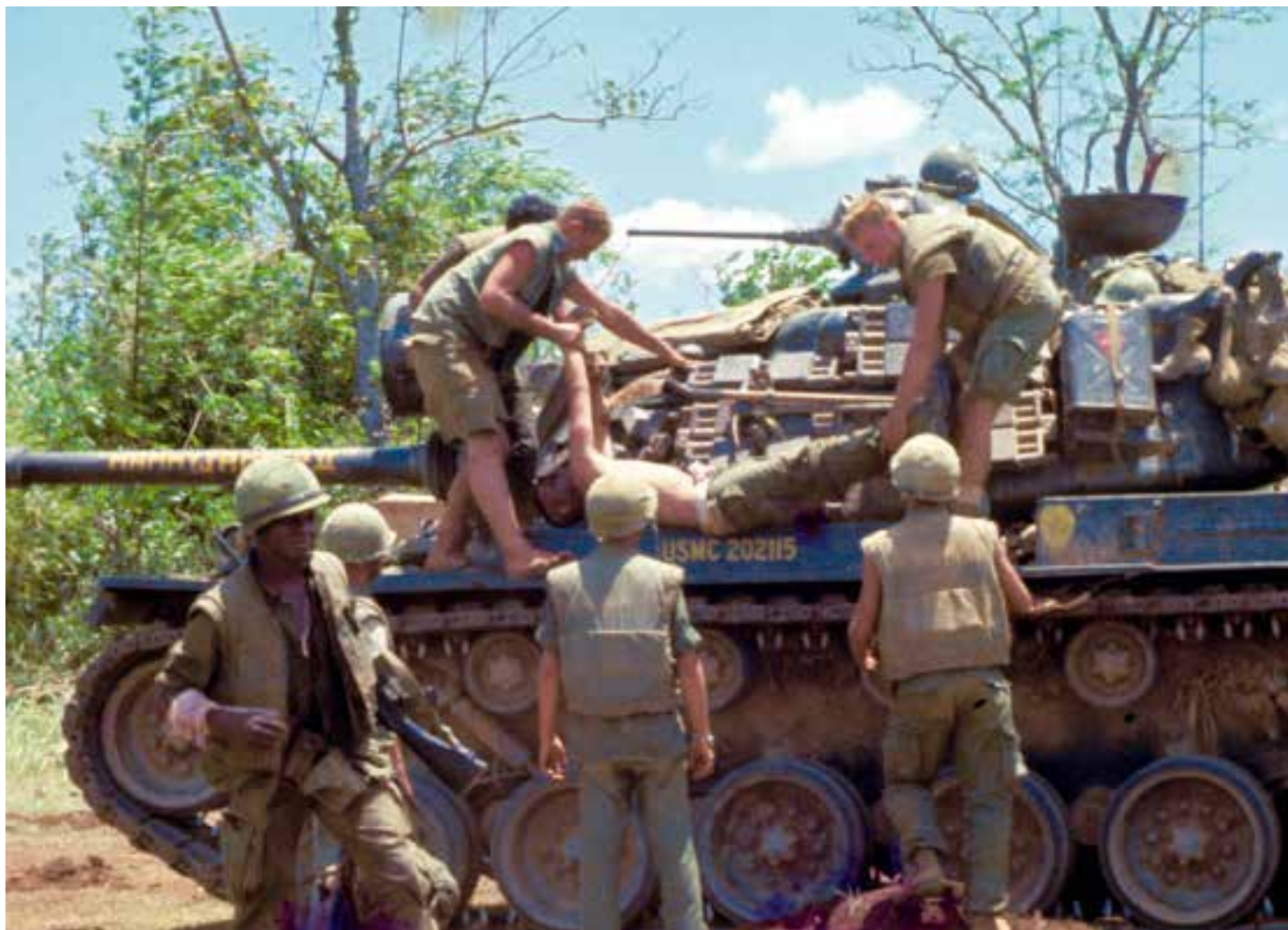
▲ Déchargement d'un blessé par des Marines lors de l'opération « Buffalo » depuis le M48 Patton « Mammyjammer II » de la A Company, 3rd Tank Battalion .

sont sabordés par le génie. À 10h30, toutes les unités engagées dans l'opération font leur jonction sur un large front en repoussant les forces Viêt-Cong vers la mer et les positions de blocage au nord et au sud après des combats très difficiles. Les pertes Viêt-Cong s'élèvent à 614 morts, 9 prisonniers et un nombre indéterminé de blessés. De leur côté les Marines ont perdu 45 tués et 203 blessés, dont un tué et 13 blessés parmi les 47 tankistes engagés. Cette première opération a démontré que face à un ennemi aussi déterminé et organisé, les chars devaient respecter à la lettre leur doctrine d'engagement en se déployant en permanence aux côtés de l'infanterie. C'est leur seule garantie de survie face à la menace des RPG mais aussi des attaques « au corps-à-corps » avec des charges explosives et/ou des grenades. Malgré cette première expérience, la leçon ne sera pas nécessairement retenue en toute circonstance.