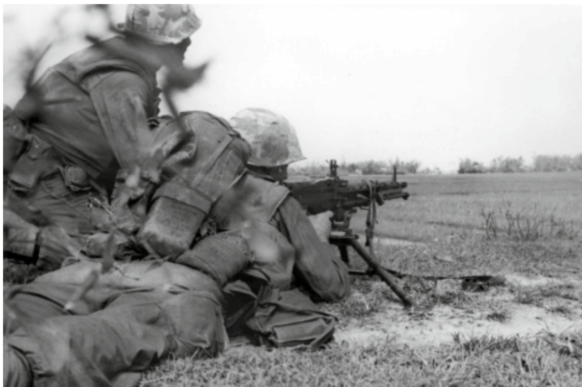
► En 1967, lors de l'opération « Chinook II », un binôme de mitrailleurs des Marines tient sous son feu une section du paysage. Leur M60 est utilisée posée sur son trépied, loin de l'image habituelle du bipied fixé sous le canon.