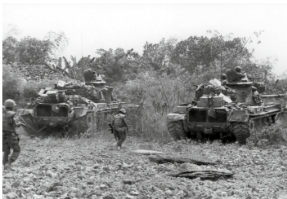
◀ Des M48 Patton (B Company, 5th Tank Battalion) progressent au sud de Da Nang en mai 1968, couverts par leurs fantassins. On distingue les grilles de ventilation du moteur situées à l'arrière de l'engin.